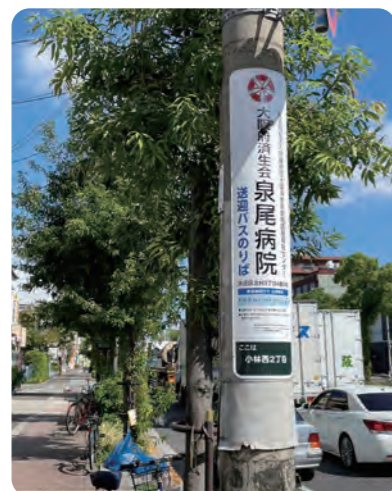
大正小林郵便局付近