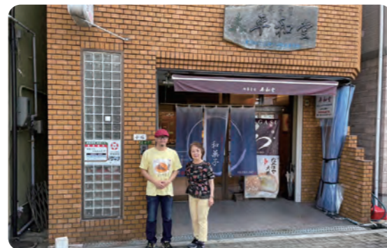
御菓子司 平和堂本店