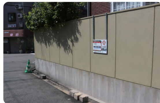
池畑興産モータープール付近