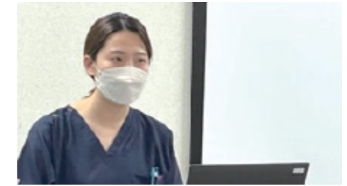
演題【2】 放射線科検査時の入院患者の リストバンド未着用の検討 放射線科 診療放射線技士 出原 須美玲