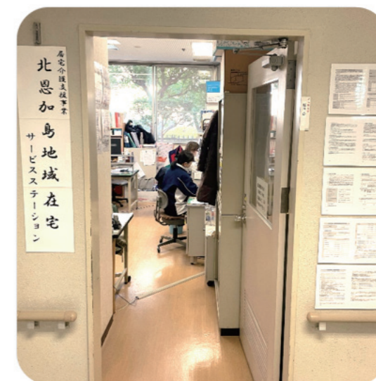
大正園事務所に向かって左にあります。

介護について、困りごとや相談があれば大正園内の1階に事務所がありますので、お気軽にお立ち寄りください。お電話の相談も承っております。