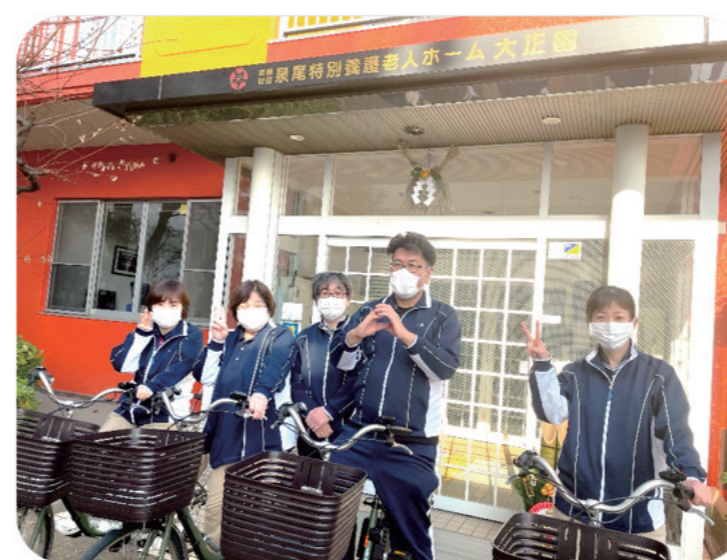
自家用車に乗ってご自宅へ訪問いたします!

定期的にご自宅へ訪問し、本人やご家族の状況に変化は無いか、利用している介護サービスに問題は無いか、新たなお困りごとは無いかを確認し必要な相談支援や調整を行います。また看護師、歯科衛生士、社会福祉士、介護福祉士と様々な基礎資格を持ったケアマネジャーが在籍しているため、各々の強みを活かし協力しながら支援が出来るのも当事業所の特徴といえます。