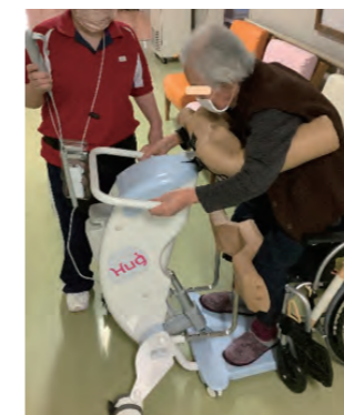
介護機器を使用中

利用料は、年間の収入額によっても変わりますが、介護施設の中でも比較的利用しやすい金額でご利用いただくことができます。