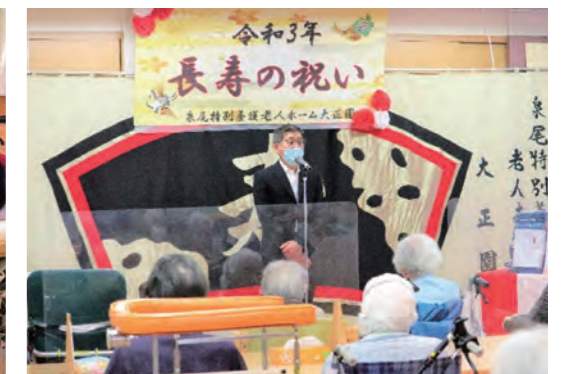
長寿の祝い 式典の様子

見学や施設についての詳しい説明は、大正園までお気軽にお問い合わせください。 (06-6552-3323 代表)