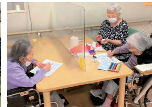
食事席での余暇活動